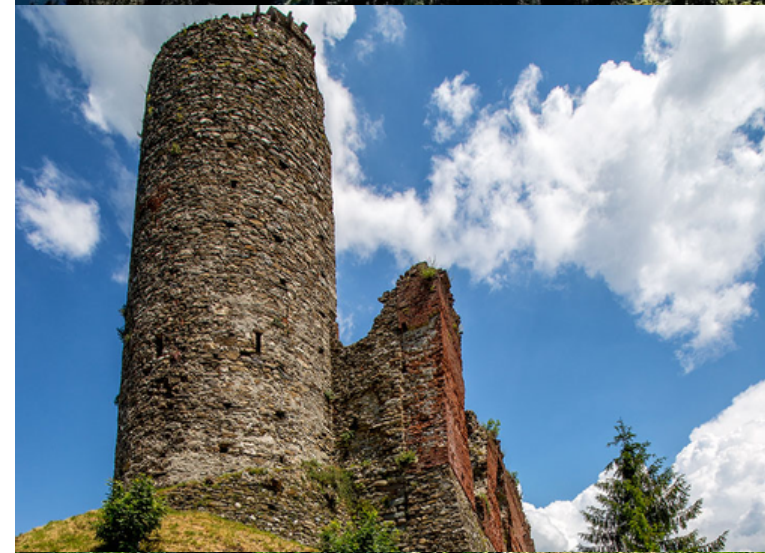
CASTELLO DI BORGOFORNARI