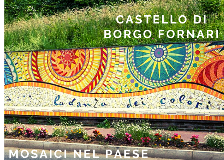
MOSAICI NEL PAESE