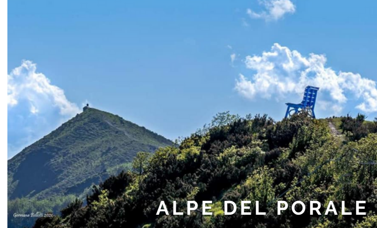
ALPE DEL PORALE