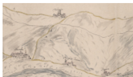
Borgo de' Fornari tra Busalla e Ronco nella carta settecentesca di Matteo Vinzoni